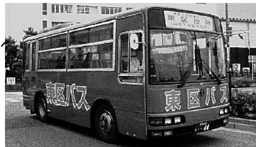
松崎ルート 青色のバス （46人乗り小型バス）