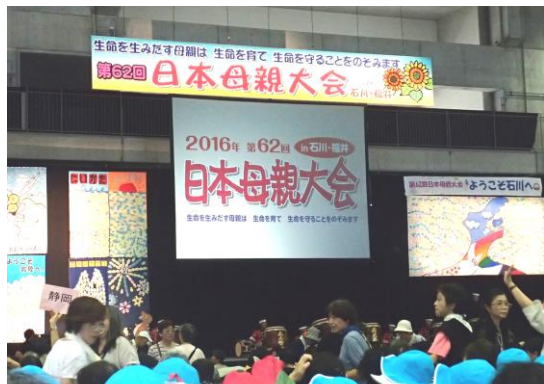
第62回日本母親大会全体会の会場風景

2016年8月29日 日本共産党 新潟市議会議員団 電話 025-226-3450 FAX 025-223-7748