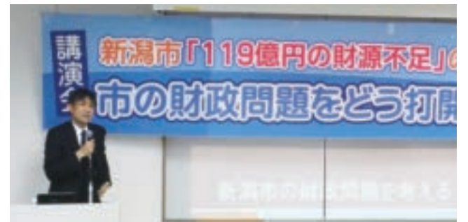
市議団が主催した新潟市の財政問題の講演会(2月14日)

2月13日に新潟市が発表した2018年度当初予算案は、17年度比173億円減(△4.4%)の3802億円となりました。「119億円の財源不足」と言われているなか、全事務事業点検により46億円、公債費積立ルールの変更で26億円など計90数億円の調整を行うことにより予算案が編成されました。