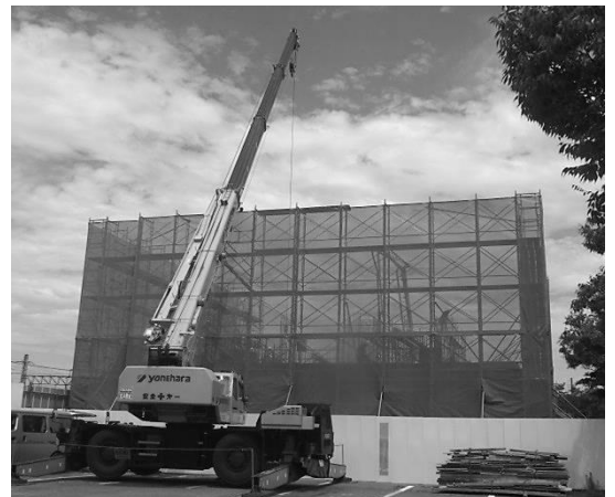
建設が進む薬科大学=2階までの鉄骨完成