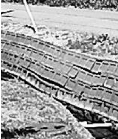
西島用水路破損箇所