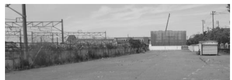
市日以外はいつも空いている