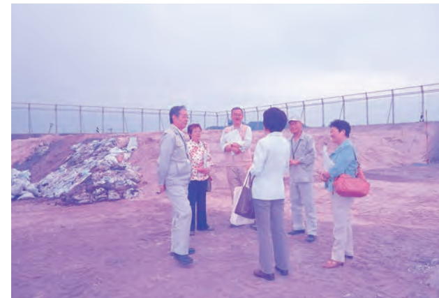
太夫浜処分場を視察