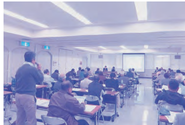
共産党市議団の議会報告会

各議員が昨年の9月と12月議会に取り上げた質問を中心に報告します。今年も、みなさんの声が生きる市政実現へがんばります。