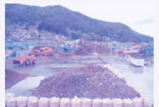
大槌町の震災がれきの状況

12月議会でも、新田清掃センターや亀田清掃センターでの基準値を超えた鉛や水銀の検出や新津クリーンセンターではいじん濃度が基準値を超えた問題等について市の対応をただしました。