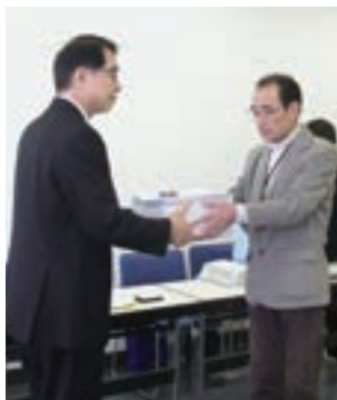
国保料引き下げ署名を提出する市民団体代表

日本共産党市議団や「新潟市の国保をよくする会」は、2018年度の国保会計は約13億円の黒字見通しであることから、保険料のさらなる引き下げを求めています。