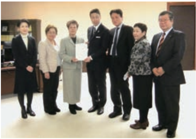
米山県知事に予算要望書を手渡す市議団(写真は17年1月)