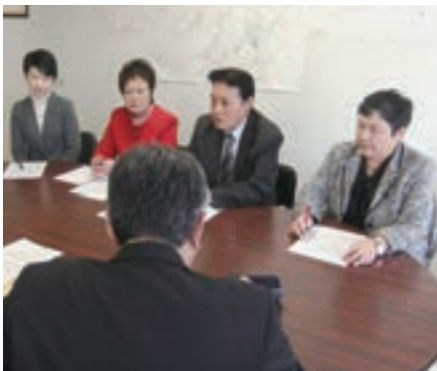
大雪問題で市に申し入れを行う市議団

申し入れは、①除雪の進まない生活道路をはじめ道路除雪に万全を期す②通学路をはじめ歩道の除雪に万全を期す③運休となっているバス路線の除排雪を進め、早期に運行をはかる④高齢者相談窓口を全区に設置し、テレビなどで周知をはかる⑤農業、商店街の被害の把握に努め、復旧のための必要な支援を行う—などです。