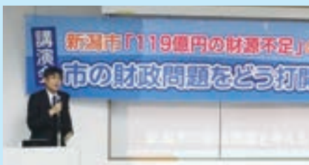
市議団が主催した新潟市の財政問題の講演会(2月14日)

新年度予算案では、全事務事業点検により市民犠牲となるものが続出しました。一方で水と土の芸術祭、BRT、新潟駅周辺整備などは推進であり、さらに今後多額の費用が必要となる事業の頭出しもあります。これでは市民の理解は得られないことは明らかです。